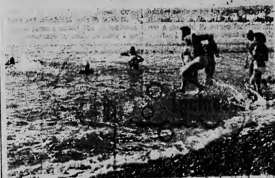
SIN NINGUN PROBLEMA Mientras cu na Hulanda tur hende ta bon bisti cu winterjas pisa, den sur di Francia tin un tempo di mas sabroso cu por desea. Riba e foto aki bo ta hanja un idea.